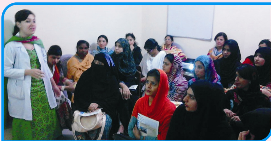
WORKSHOP FOR TEACHERS