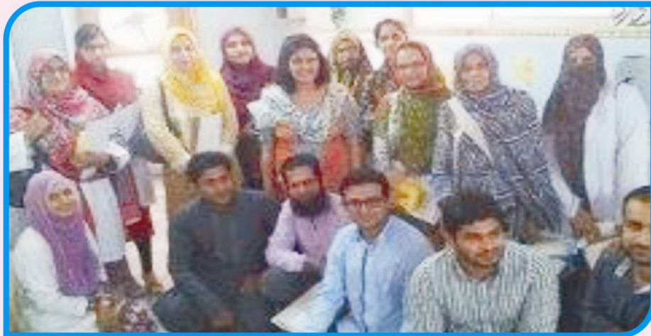
WORKSHOP FOR DOCTORS