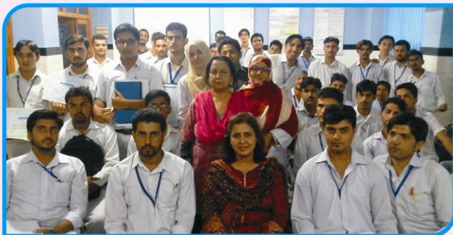
WORKSHOP FOR PARAMEDICS (MALE NURSE)