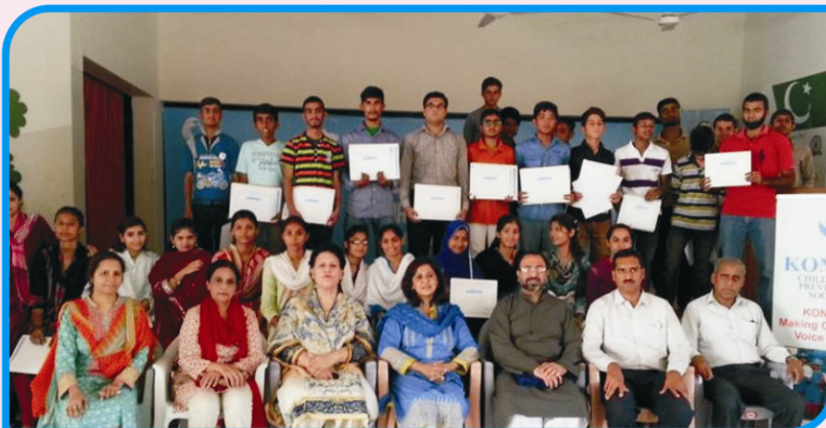
WORKSHOP FOR YOUTHS OF SOS VILLAGE