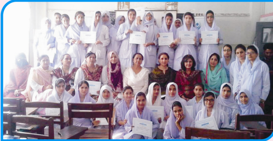
WORKSHOP FOR LADY HEALTH VISITORS