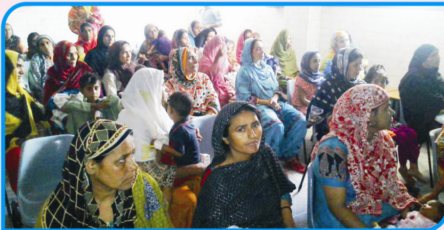
WORKSHOP FOR MOTHERS